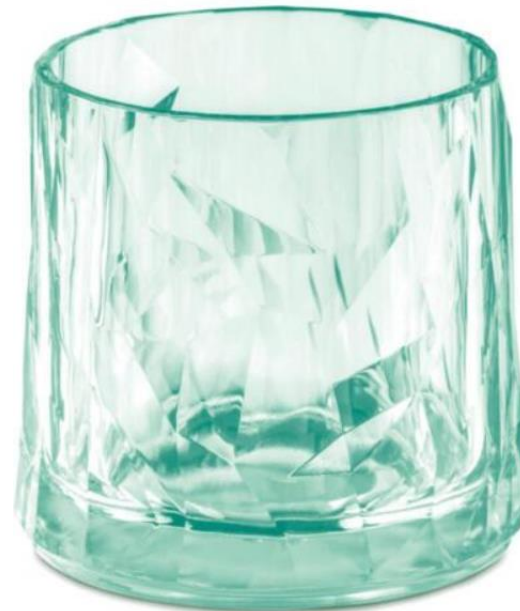
Table Art folgt dem Fashion & Home Living Trend. Es wird dekorativ und gerne bunt. Freuen Sie sich auf neue Glaskunst.